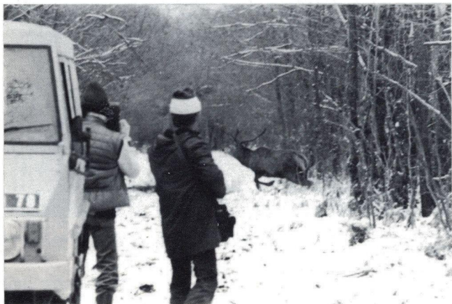
FR 3 Orléans-Centre, décembre 1981. Équipage Chaudenay.

commune. Richard Leceux, caméraman habitué au tournage sur la vénerie, puisqu'il en a, me semble-t-il, réalisé plus de quinze, était lui-même enthousiasmé. Le soir même, retour sur Paris pour le dîner du congrès des Présidents.